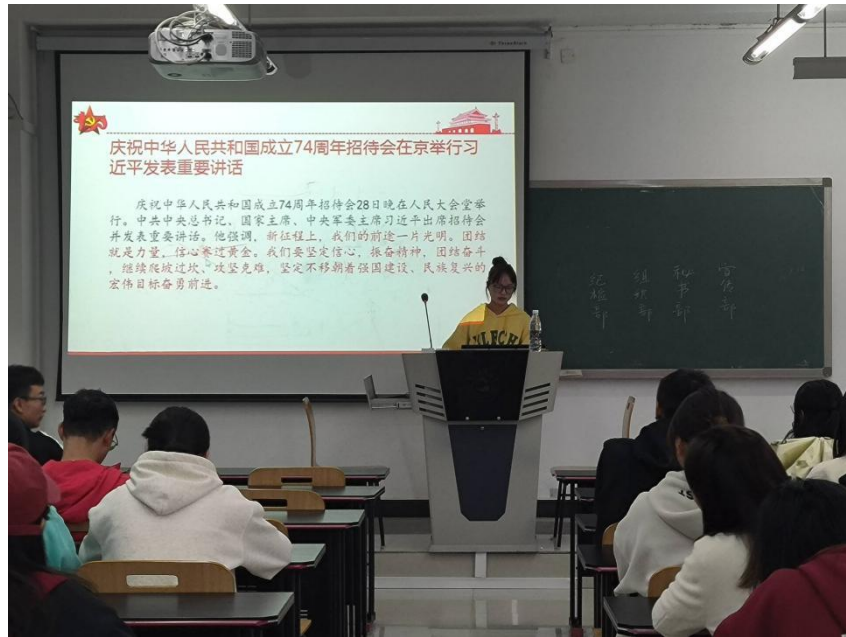
庆祝中华人民共和国成立 74 周年招待会在京举行习近平发表重要讲话